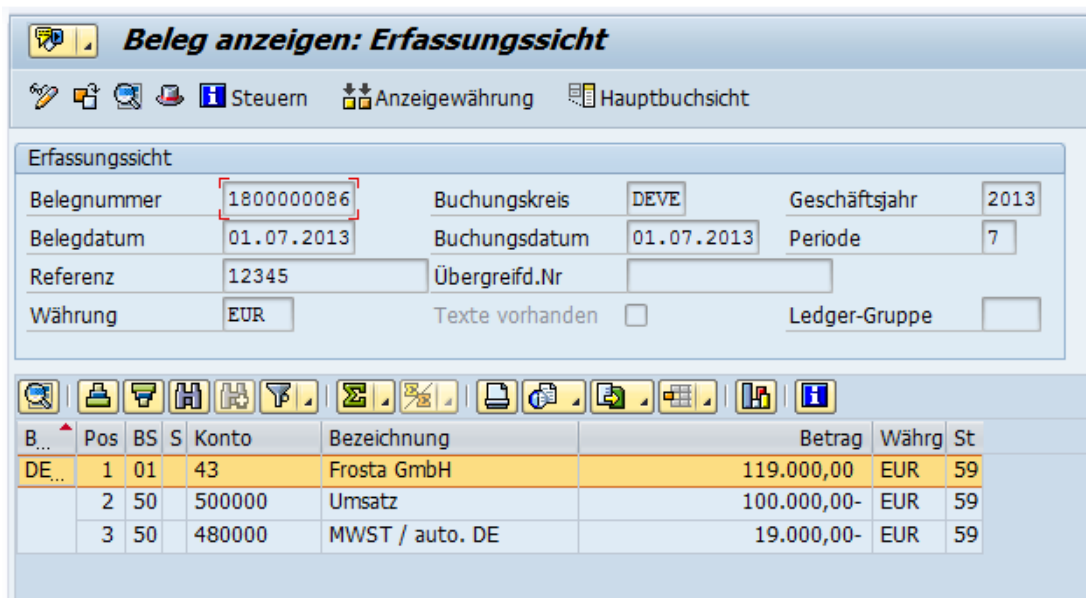
Abbildung: Beleganzeige (FB03)

Im Fall, dass die Batch Input Mappe fehlerfrei abgespielt wurde, endet der Prozess mit den gebuchten Belegen im Rechnungswesen: